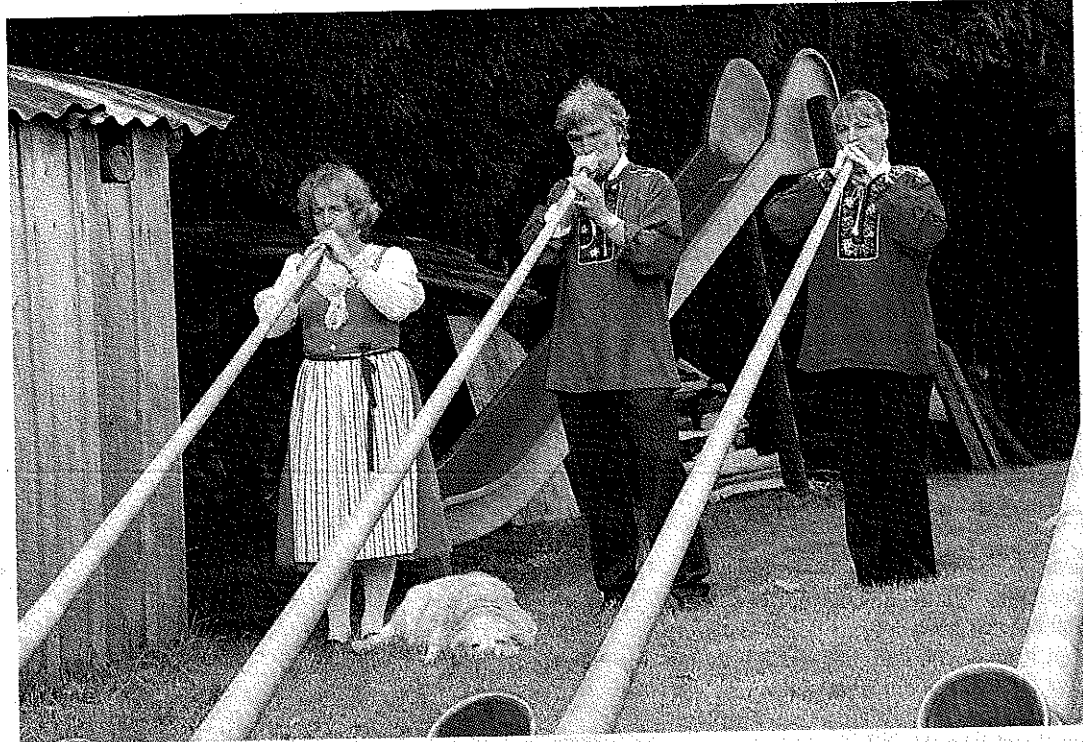
Die Zuri-Oberländer-Alphornbläser sind auch in diesem Sommer zu Gast an der Bächenhilbi.