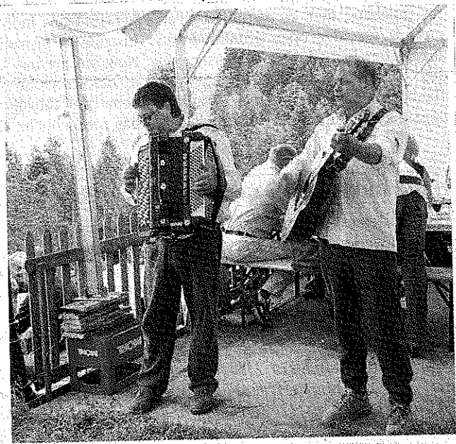
Die Entertainer live unterhalten auf Unterbächen.